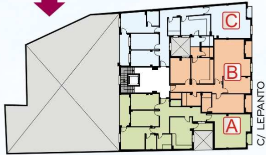
PLANTA 1ª Y 2ª