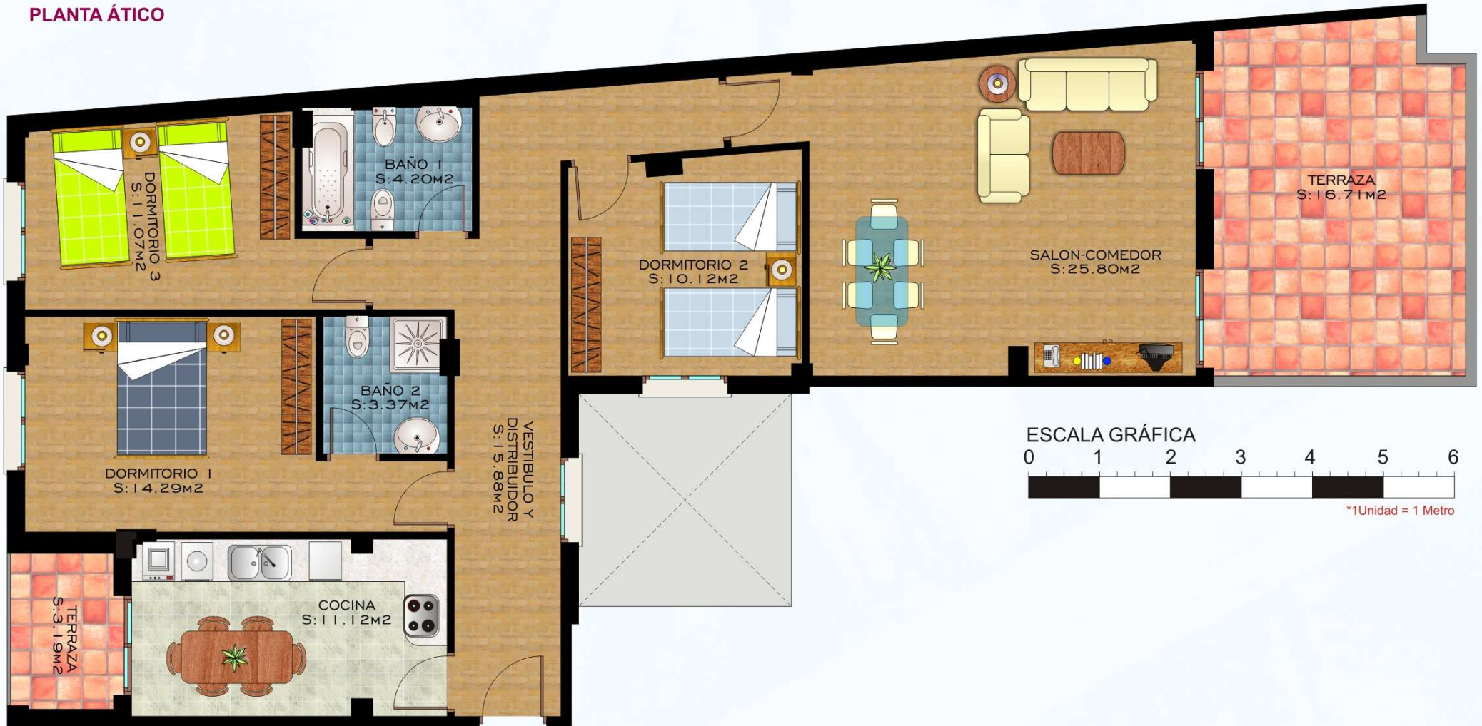
VIVIENDA "C" S: 99.04M 2